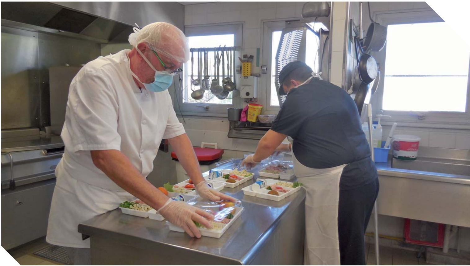
Le portage des repas maintient son menu unique pour garantir le service et le protocole sanitaire.