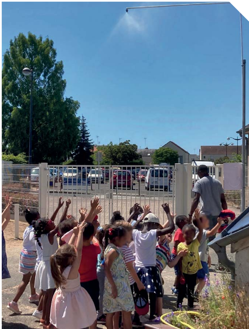
Grâce aux brumisateurs, les enfants ont pu profiter de la cours de récréation durant les fortes chaleurs de mai et de juin.