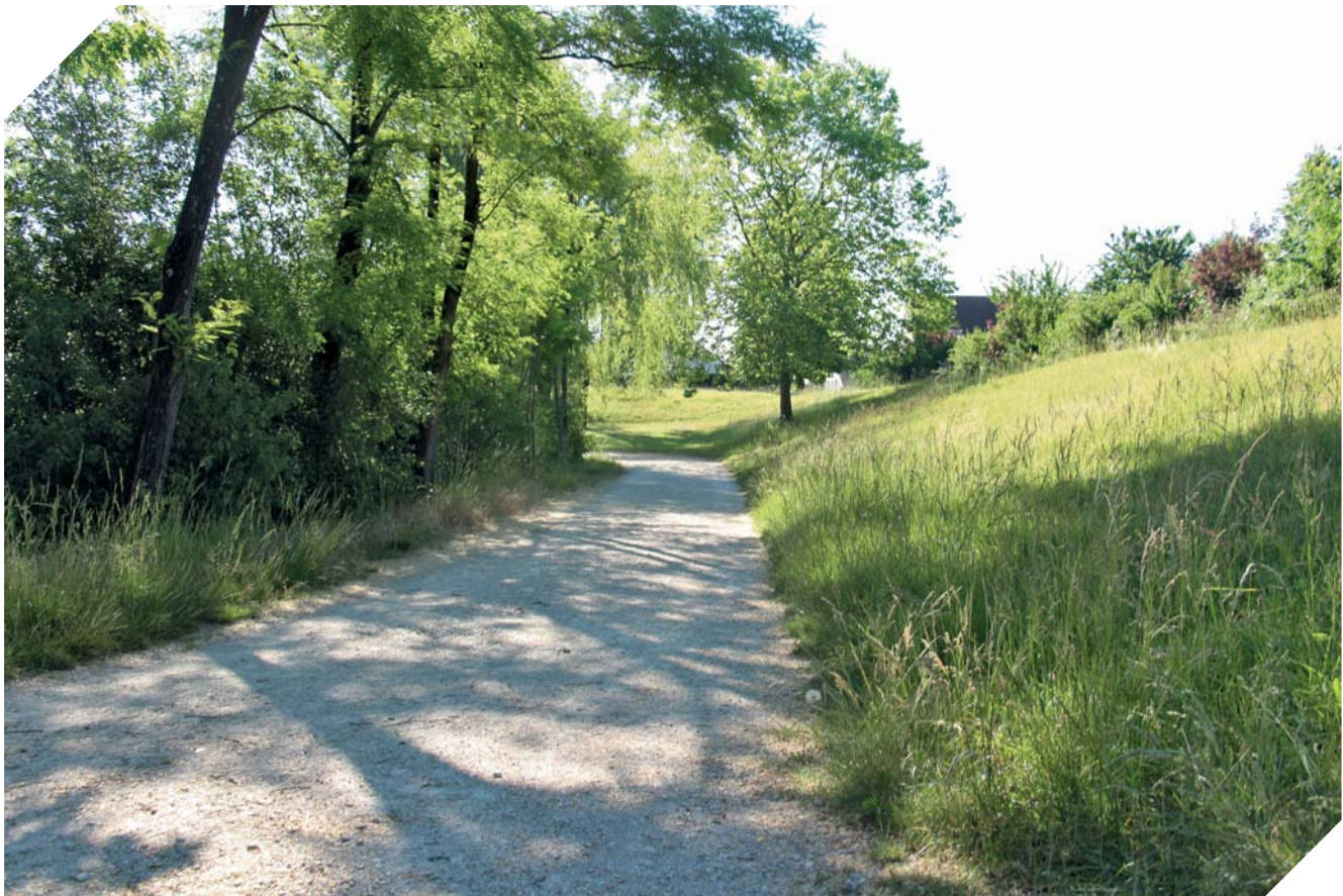
La Ville expérimente des zones non tondues dans des endroits peu fréquentés par le public comme le fond du parc de l'Hermitage.

Depuis cette année, la Ville de Fleury-les-Aubrais expérimente sur certains espaces une nouvelle gestion de la tonte, plus raisonnée et favorisant la biodiversité.