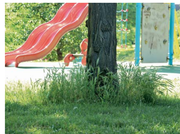
Des cercles jusqu'à 1 m de diamètre seront laissés non tondues autour de certains arbres pour préserver leurs racines.

Avec cette expérimentation, la Ville poursuit la mise en place d'une gestion différenciée de ses espaces verts dans une logique durable, raisonnée et respectueuse de l'environnement.