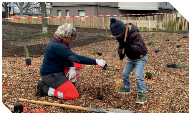
Plantation des micro-forêts avec les enfants des accueils de loisirs

Toute l'année, Fleury-les-Aubrais organise de nombreuses actions destinées à sensibiliser le public sur l'environnement et le patrimoine végétal comme l'installation de jardins consommables, les Rendez-vous du printemps, le Troc et vide-jardin, etc. La Ville organise également différentes actions pour les enfants comme les animations natures proposées au Domaine de La Brossette, l'installation de jardins pédagogiques dans les écoles ou d'une ferme positive dans