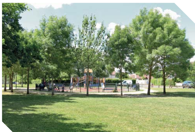
Aire de jeux au Clos de la Vallée

La première ambition est de conserver nos deux fleurs en maintenant notre action sur la qualité de vie à Fleury et de poursuivre notre ambition d'une gestion plus écologique, durable et raisonnée du patrimoine végétal de notre ville. Cela représente près de 780 000 m 2 à entretenir pour nos jardiniers (sans compter la partie gérée par Orléans Métropole)!