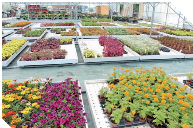
Les serres municipales

Le jury a reconnu la qualité de la gestion des massifs et du patrimoine végétal. En effet, la Ville réalise actuellement un inventaire de son patrimoine arboré qui va permettre à terme d'établir un plan de gestion raisonné pour l'entretien et la plantation des arbres. La Ville restructure aussi ses massifs qui sont maintenant composés d'un tiers d'arbustifs, d'un tiers de vivaces-graminées-bulbes et d'un tiers de fleurissement événementiel (par saison) pour faire évoluer ses espaces toute l'année et plus seulement en été.