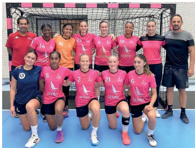
Équipe du CJF handball N1