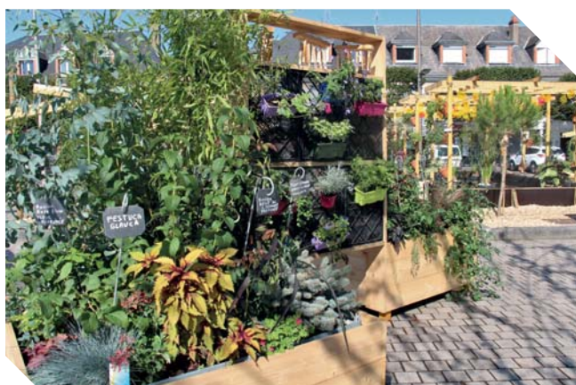
Les jardins éphémères

Lors de son passage, le jury a félicité l'engagement de la Ville dans sa démarche de développement durable. Pour favoriser la biodiversité, une gestion différenciée de la tonte a par exemple été mise en place. La hauteur de coupe a été remontée de quelques centimètres et sur la période estivale certaines zones peu fréquentées par le public ne sont plus tondues et fauchées à l'automne.